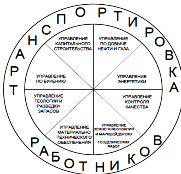
Рис. 2. Влияние организации транспортировки вахтовых работников на функционирование нефтегазового месторождения ПАО «Верхнечонскнефтегаз»

С целью изучения значимости вопроса организации транспортировки вахтовых работников в функционировании нефтегазовой компании в 2016 г. авторами данной статьи было проведено социологическое исследование в ПАО